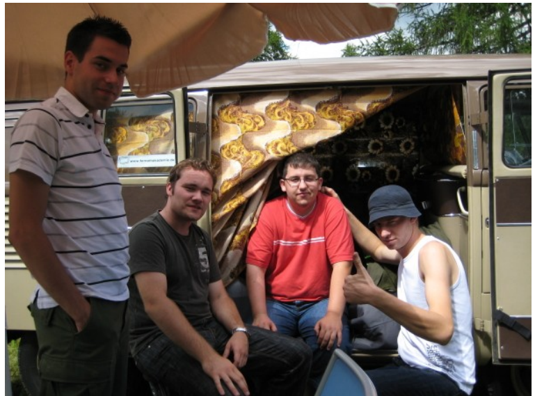
Die Jungs vorm Bulli

Wir machten es uns einfach bequem, betrieben Körperpflege oder verglichen Ferngläser, also alles in allem ein recht ruhiger Sonntag.