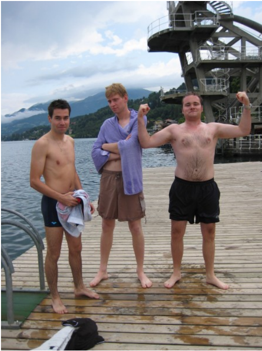
Unsere sexy Andromeda-Boys