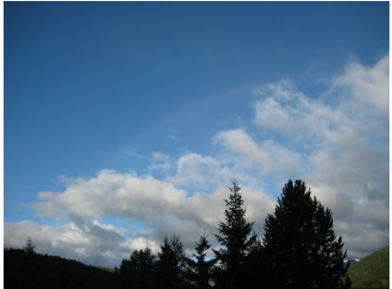
Ein Regenbogen... zum Abschied