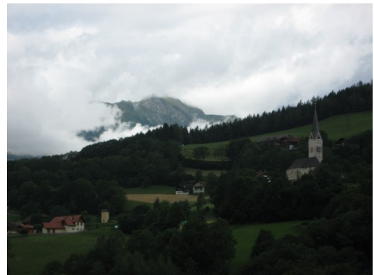
Unterwegs nahmen die Wolken immer mehr zu...

Gegen elf stiegen wir alle in Martins Bus und fuhren los zum Millstätter See. Bereits unterwegs wurde das Wetter jedoch zunehmend schlechter und als wir am See angelangten, tröpfelte es.