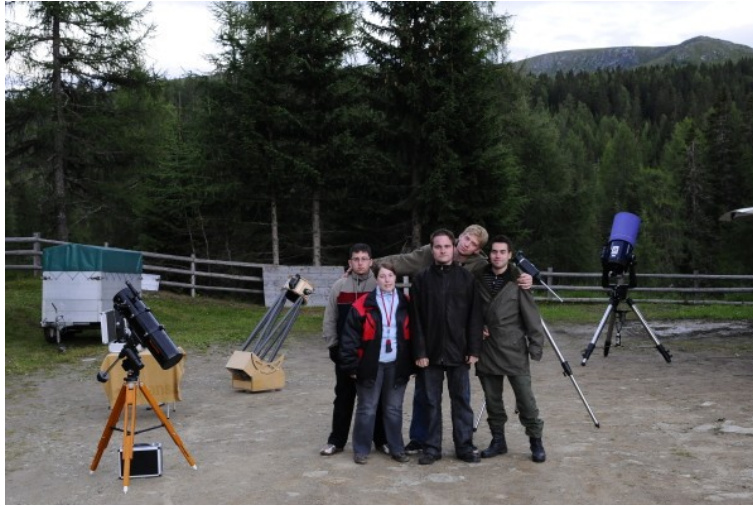
Mal alle zusammen...

Als es dunkel war, kamen einige Hüttengäste und die Wirtin, die von uns einen kleinen Einblick in den Himmel erhielten. Mit den Lasern wurden Sternbilder gezeigt und an den Teleskopen gab es Jupiter, Andromeda, Ringnebel, Cirrus, den Herkuleshaufen und einiges mehr.